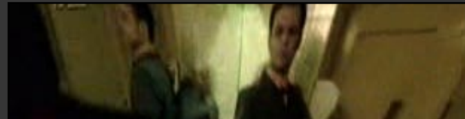
szene 4: meeting