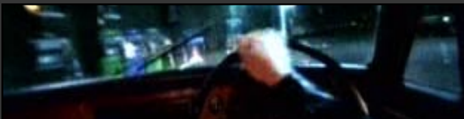
szene 2: fahrt ins blaue