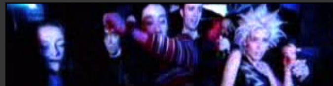
szene 5: themenabend