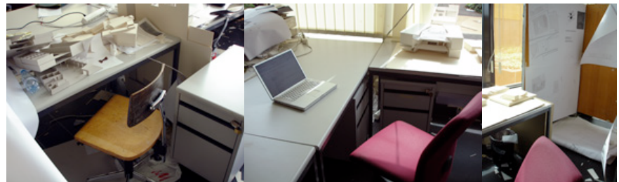
Arbeitsplatz 3. Klasse

1. Spielphase: während der ersten Woche sind alle Spieler gleichberechtigt. Mit der Basisausrüstung von einem Arbeitstisch, einem Holzstuhl und einem Korpus haben alle die selben Voraussetzungen um Punkte auf ihrem Konto zu verbuchen. Am Ende dieser Woche wird der Zeichensaal umgestellt, in die drei Klassen eingeteilt und den Glücklichen zusätzliches Material zur Verfügung gestellt.